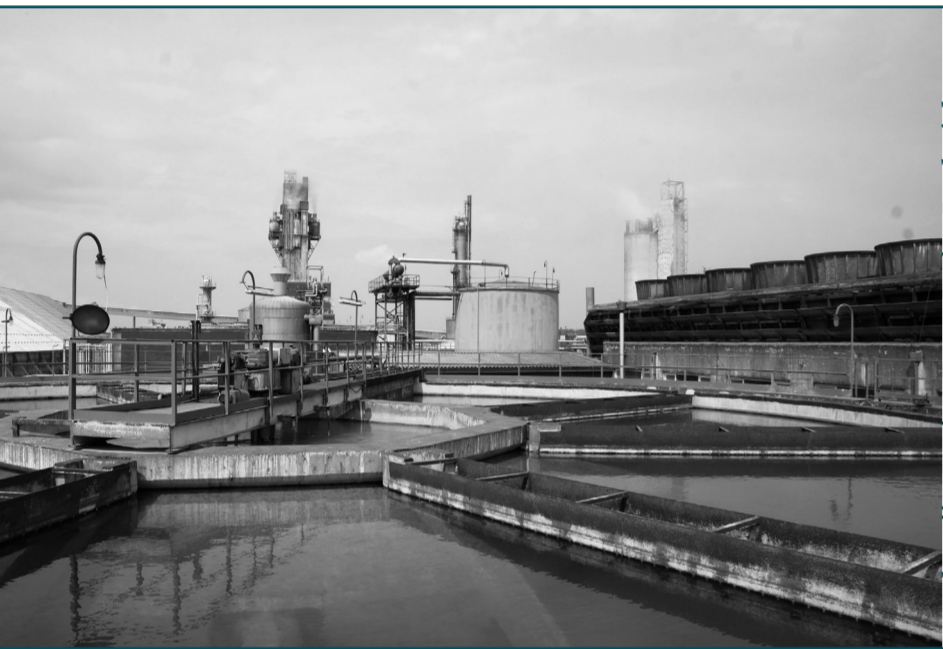
Petrokemija. Kutina

Razmatranje promjena olakšava predviđanje događaja i trendova u zdravstvu. Ne treba očekivati da će se nadolazeće promjene uvijek moći eksplicitno povezati s privatizacijom zdravstva, jer njegova neefikasnost već u ovom obliku nekima donosi veliku korist. Kao što kaže Nataša Škaričić: “Pripuštanje privatnih elemenata ne odvija se dakle toliko kroz formalne suštinske izmjene sustava – makar tu ima nekih sitnih primjera – koliko kroz koruptivnost sustava zdravstva. Bojim se da je komocija koju elite uživaju u takvom sustavu jedini razlog zašto se on formalno ne privatizira, barem u nekim dijelovima.” Ipak, neke se vidljive promjene mogu očekivati. Kao što pokazuju prijašnja iskustva, promjena u statusu HZZO-a vodi do promjene opsega zdravstvenog osiguranja, odnosno do smanjivanja broja usluga bez nadoplate, što nužno ograničava dostupnost zdravstvene zaštite nekim društvenim skupinama. Nadalje, predložene izmjene zakona nisu planirane u konzultacijama sa stručnom zajednicom, što navodi na misao da će njihovo donošenje biti u najmanju ruku beskorisno, a možda i štetno za one koje žele regulirati. Konačno, prekid pregovora oko dopuna kolektivnog ugovora u zdravstvu pokazuje da još nije došao kraj rezanju prava radnika u javnom sektoru. Sve to daje naslutiti kako možemo očekivati nove udarce na javni karakter zdravstvenog sustava, što nužno povlači gore uvjete za zdravstvene radnike, ali i za sve korisnike sustava ●