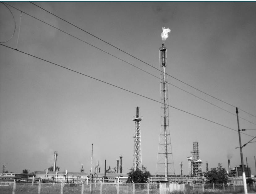
Sisačka rafinerija

Zakonskim odredbama se isprva nije zahtevala provera imovine kupaca, pa se dešavalo da privatizacija preduzeća služi čistom pranju novca