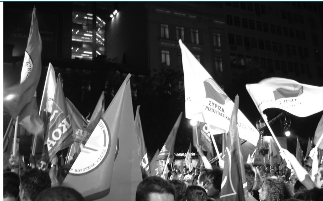
Skup podrške Sirizi